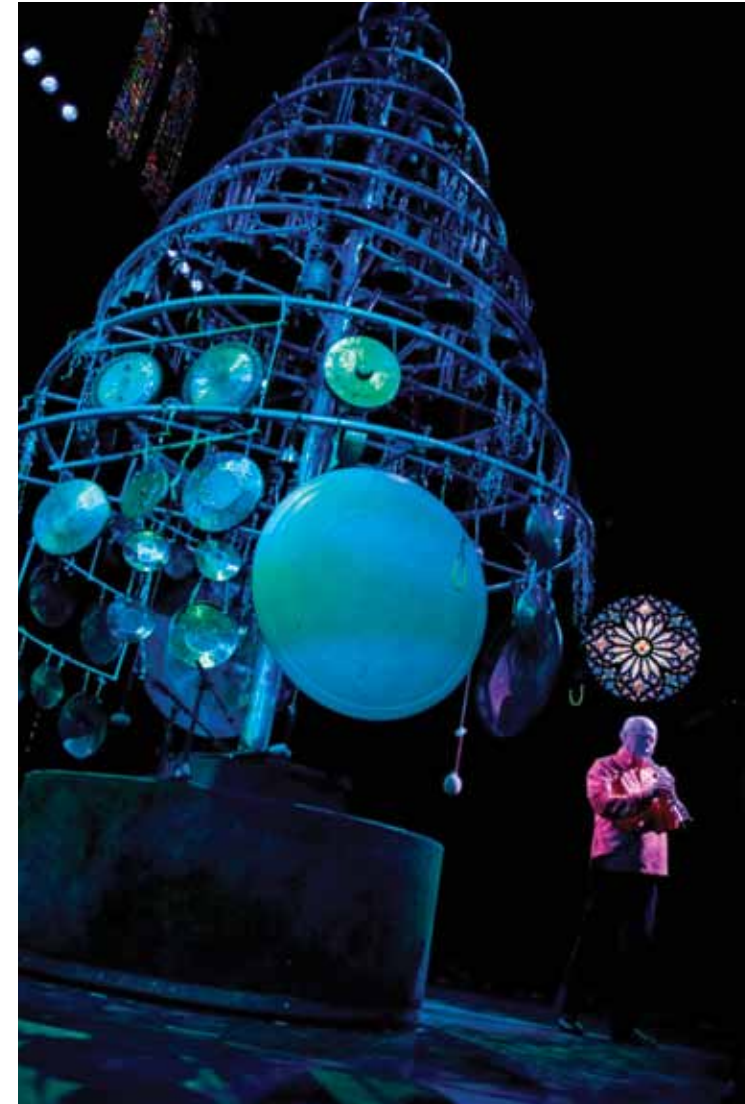
Cortesía de Steve Shelley

Con Vectorworks Spotlight 2013, la tradición continúa.