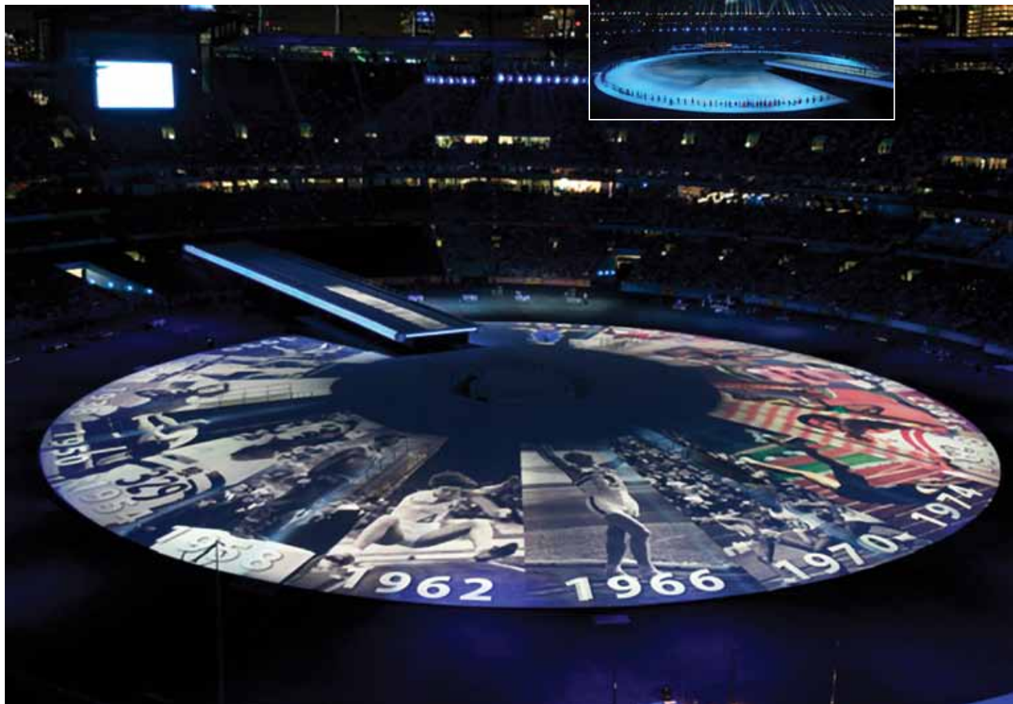
“Las ceremonias de apertura y cierre de los XVIII juegos Commonwealth”.

“Descubrí que la interfaz del usuario de Vectorworks es altamente intuitiva y sencillamente adaptable. Y lo más importante, es muy utilizada por mis colegas y ha surgido como el nuevo estándar del sector”. – Tyler Littman, Sholight Entertainment Design Group, LLC